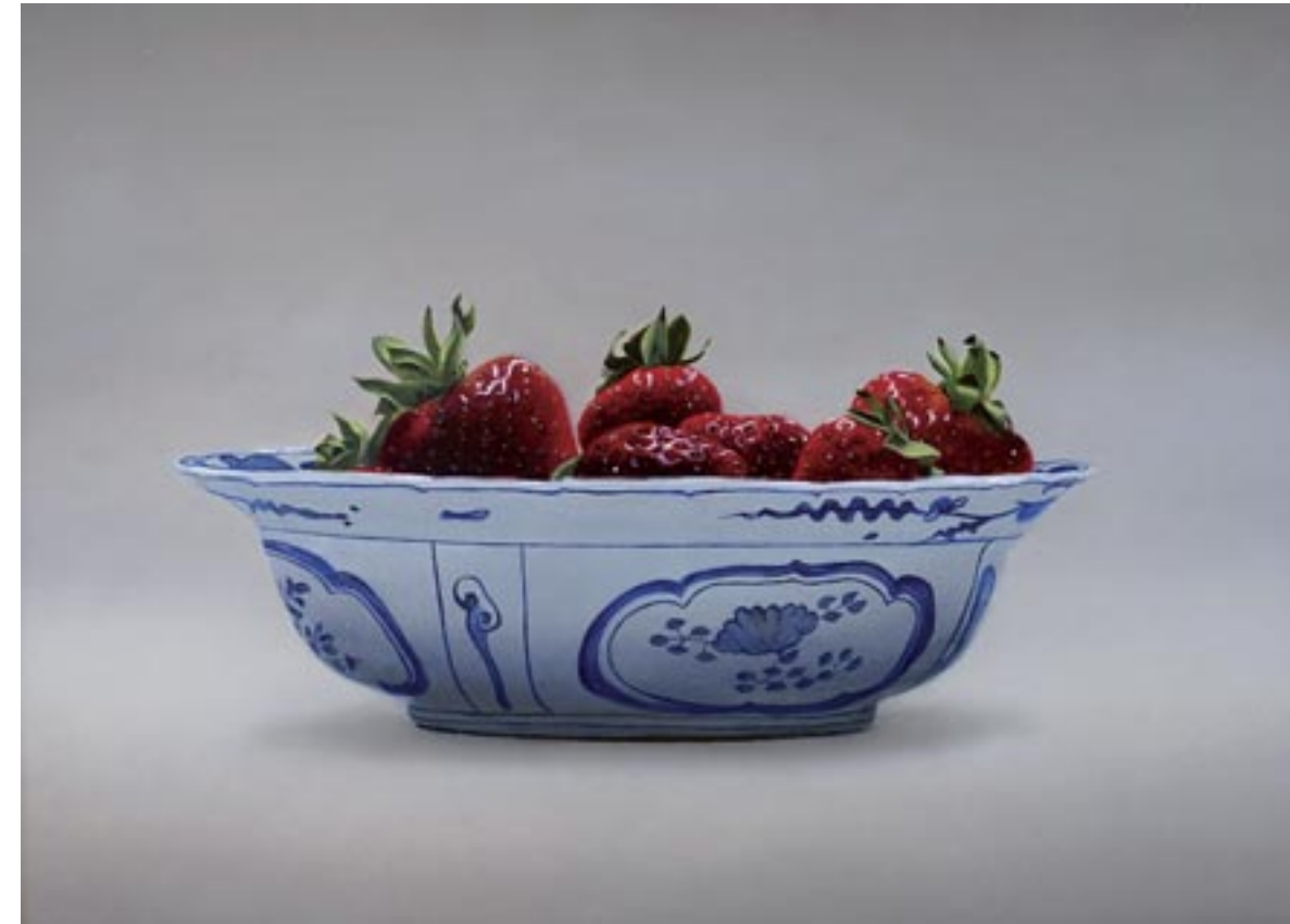
Aardbeien, 2016, olieverf op paneel, 47 x 58 cm