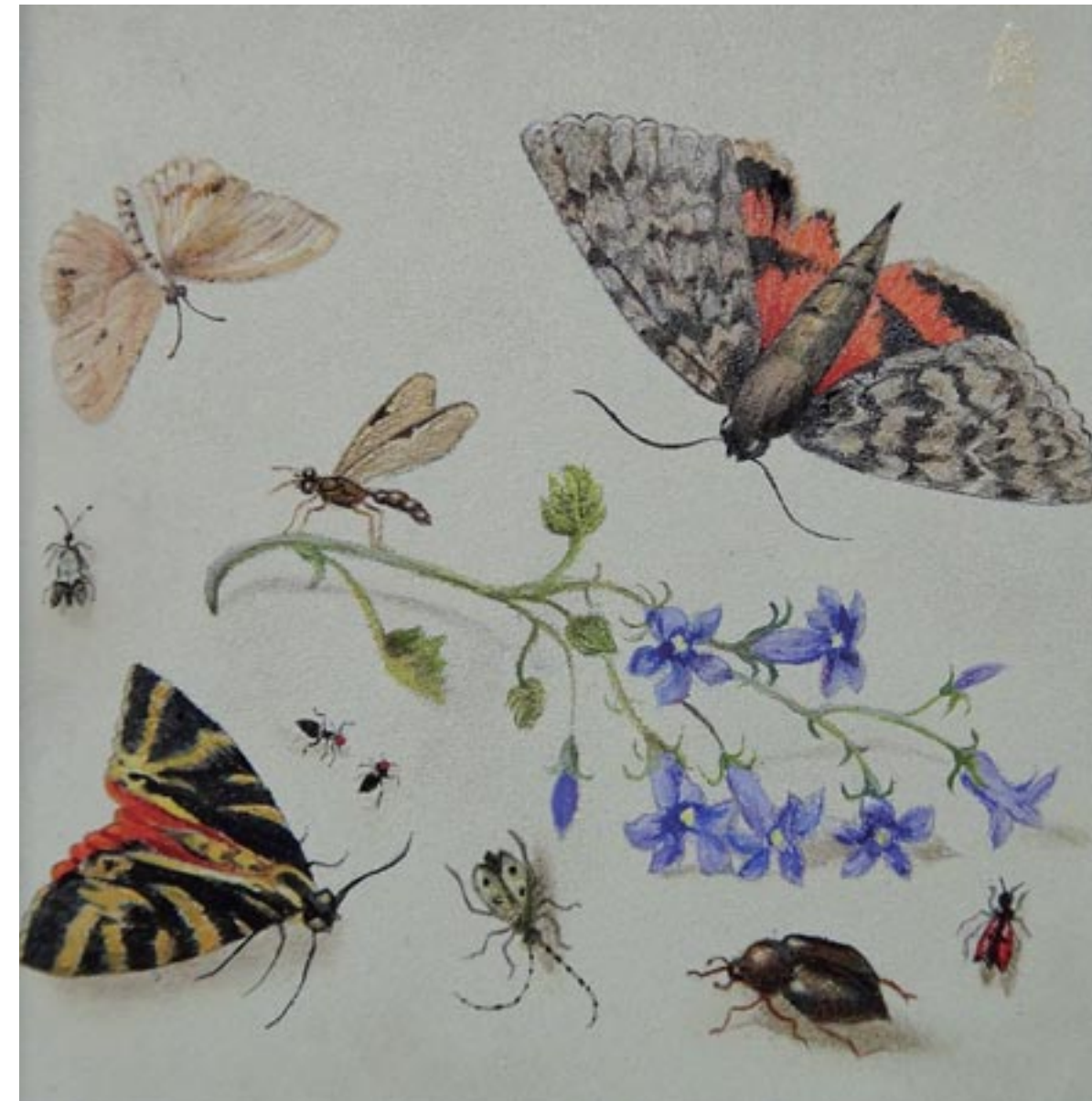
Vlinders naar Jan van Kessel B, 2013, olieverf op paneel, 15 x 15 cm