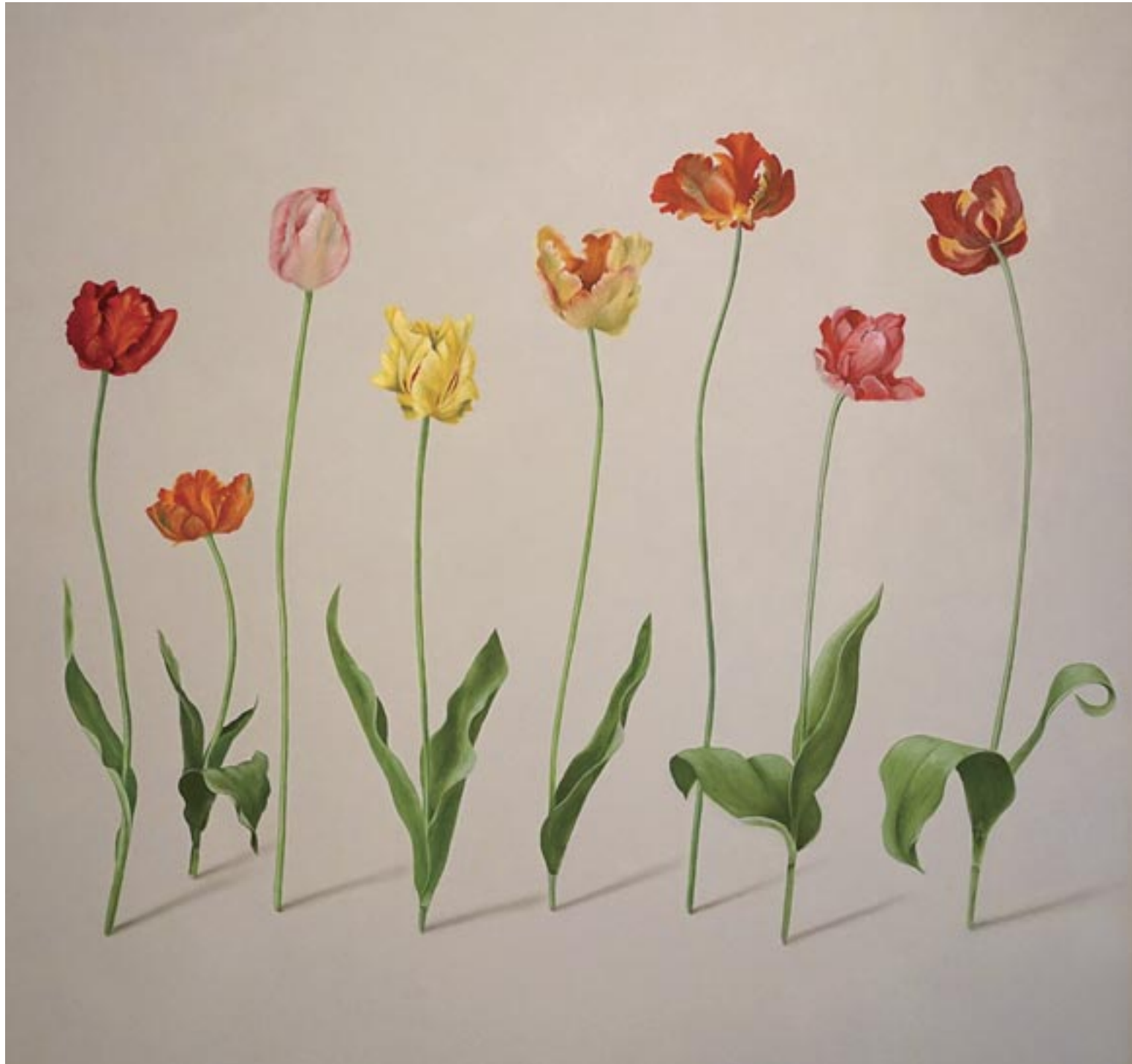
Dancing Tulips, 2016, olieverf op paneel, 90 x 90 cm

Toch is haar verhaal verrassender dan je zou vermoeden. Haar werken ogen volwassen, maar zij schildert nog maar vier jaar. Hoe heeft zij zich zo snel ontwikkeld? En hoe zit het met het engelengeduld, dat onlosmakelijk met het fijnschilderen verbonden is? Wij zitten vol vra-